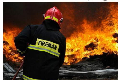
آتش سوزی انبار مبلمان اداری در مشهد- ۱۳۹۶