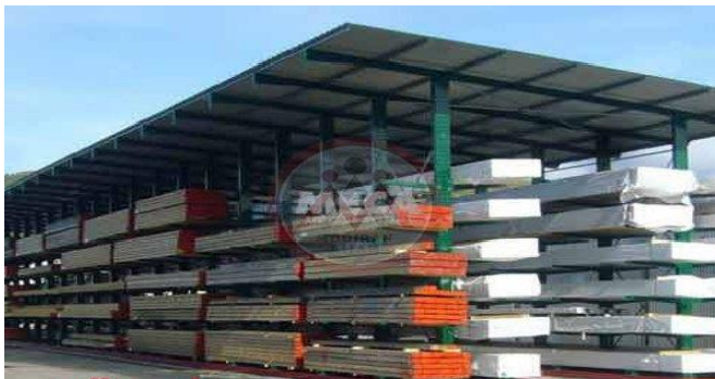
(۲) انبار سرپوشیده یا هانگار