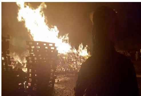
آتش سوزی انبار

یکی از بزرگترین خطرهای برای انبارها، خطر ایجاد آتش سوزی است. آتش سوزی و خسارات ناشی از آن، اعم از جانی و مالی، همیشه تأسف برانگیز و گاهی هم فاجعه‌آمیز بوده است و در صورت فقدان آموزش و رعایت نکردن موارد ایمنی، بدون شک این خطر در زمره بزرگترین خطرهای آسیب‌ها قرار می‌گیرد.