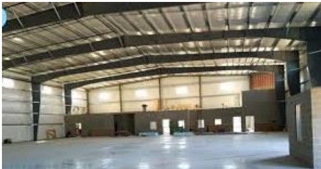
(۱) انبار پوشیده