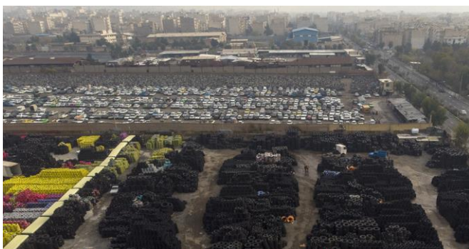
(۳) انبار باز یا محوطه