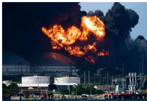
آتش سوزی در انبار نفت شهر ماتازاس در کوبا- ۱۴۰۱