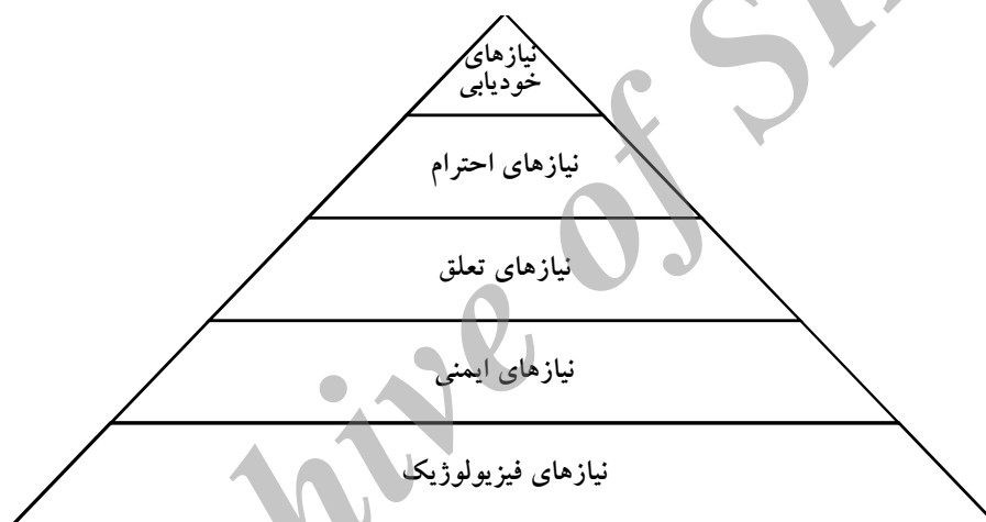
شکل ۱: سلسله مراتب نیازها در هرم مازلو (Maslow, 1970: 51-171)

تأمین برخی نیازها یا حلّ پاره‌ای از مشکلات در نهادهای اجتماعی باید دائمی باشد نه موقتی و برای دوره زمانی خاص. تحقق این مهم معلول شناسایی دقیق مشکلات و علت بروز آنهاست. فقر هرچند عامل بروز مشکلات زیادی است، اما خود معلول مشکلاتی دیگر است، مشکلاتی نظیر سبک زندگی فقرا، بیکاری، حرص و طمع و غیره.