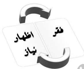
شکل ۲: رابطه دوری اظهار نیاز و فقر

می‌ترسد و مفسده فقر اظهار نیاز به مردم است، بنابراین افراد طمع برای اجتناب از فقر، دست به دامان دیگران به‌عنوان مفسده فقر می‌شوند و در نتیجه دچار فقر می‌گردند (المجلسی، ۱۴۰۴ق، ج ۸: ۳۵۵).